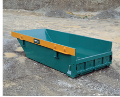
6 m 3 Mulde mit Rückladen

Höhe 103 cm Breite 205 cm Länge 437 cm Breite innen 180 cm