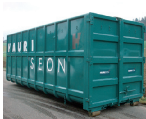
40 m 3 Roll-Container

Höhe 100 cm Breite 250 cm Länge 620 cm Breite innen 238 cm