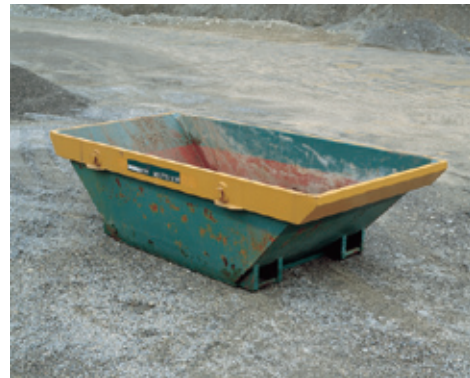
4 m 3 Mulde