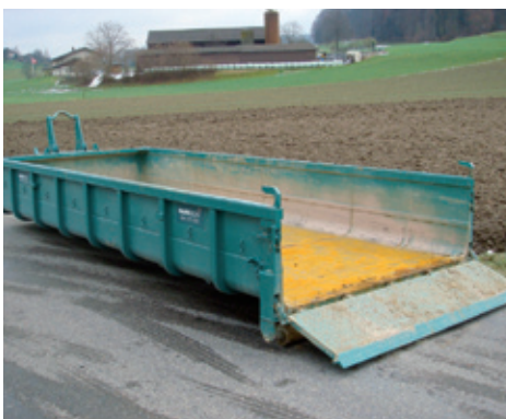
11 m 3 Roll-Container

Höhe 100 cm Breite 250 cm Länge 620 cm Breite innen 238 cm