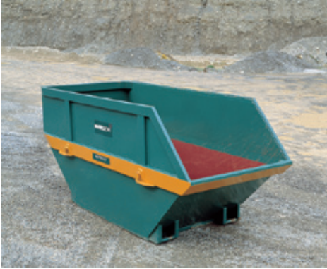
7 m 3 Mulde