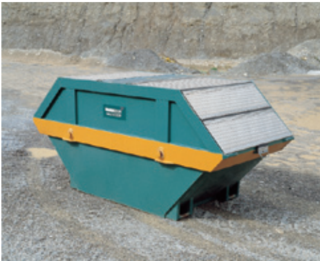
7 m 3 gedeckte Mulde

Höhe 103 cm Breite 205 cm Länge 437 cm Breite innen 180 cm